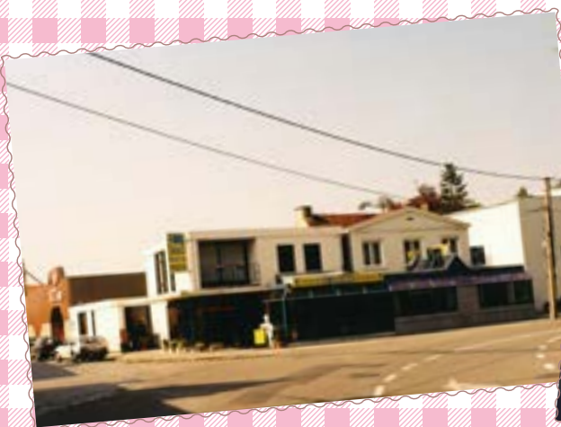
De Lekkerbek, 1981-2015