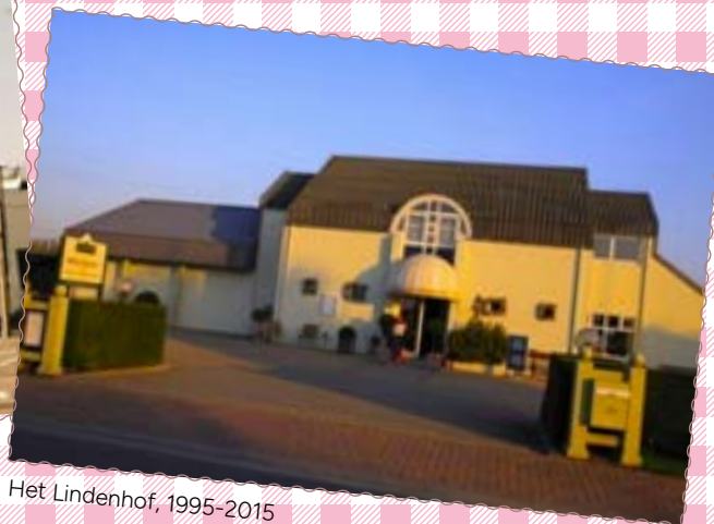
Het Lindenhof, 1995-2015