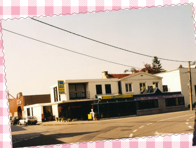
De Lekkerbek, 1981-2015