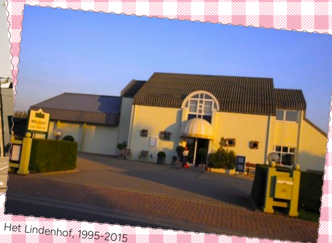
Het Lindenhof, 1995-2015